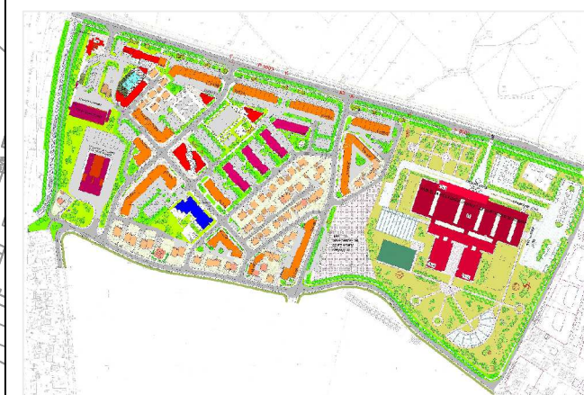
извод из важећег регулационог плана