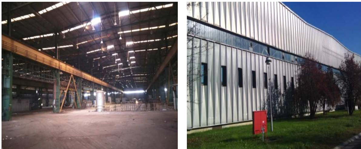
Сл.3 Фотографије унутрашњег и спољњег дијела хале